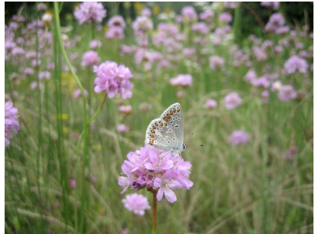
Sonnenröschen-Bläuling und Grasnelken

An dieser Stelle sei Euch nochmal die Rubrik „Wissenspeicher“ auf unserer Homepage ans Herz gelegt! Dieser Menüpunkt trägt seinen Namen so was von zu Recht, es lohnt sich auf jeden Fall, da mal reinzuschauen!