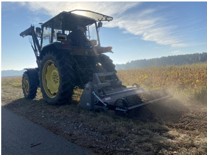
Die Umkehrfräse entfernt die Grasnarbe als Vorbereitung für die Neuansaat

Herzlichst - Katja und Georg für WWW ( wendland.wildewiese.net )