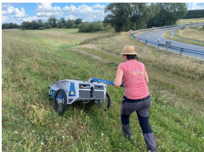
Samenernte mit dem eBeetle auf Spenderflächen

Die gesammelten Daten werden mit Hilfe von GIS-Software in vorbereitete Landkarten eingearbeitet, die dann die Grundlage für das Sanierungs- und Pflegekonzept bilden. Nach der finalen Abstimmung im Dorf und der Genehmigung der Flächeneigentümer (meist die Gemeinde) kann die Instandsetzung beginnen. Dazu wird mit Grubber und Fräse ein Saatbett bereitet und Saatgut von regionalen Spenderflächen ausgebracht. Weitere Arten werden mit zugekauftem Regio-Saatgut ergänzt. Danach, ganz wichtig, muss das Mahdregime zeitlich angepasst und das Mahdgut regelmäßig abgefahren werden. Dafür finden wir je nach Dorf eine machbare Lösung unter Einbeziehung von Bauern und Bewohnerinnen.